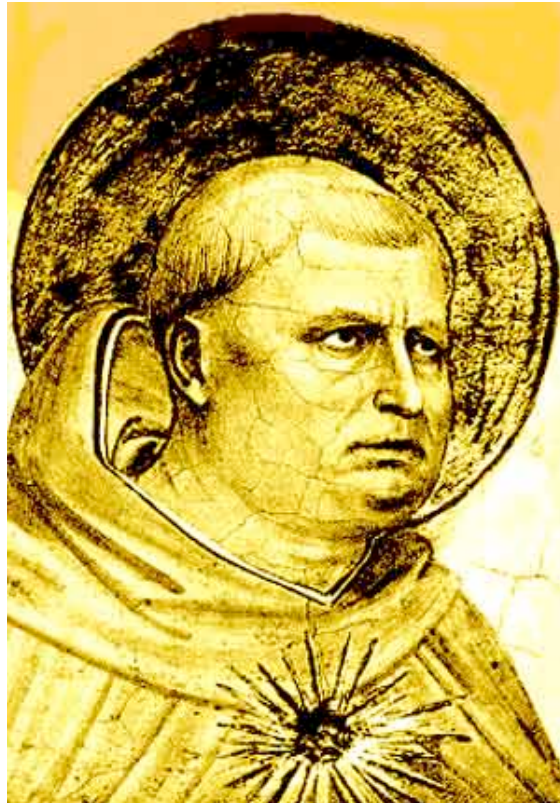
THOMAS VON AQUIN (1224–1274)